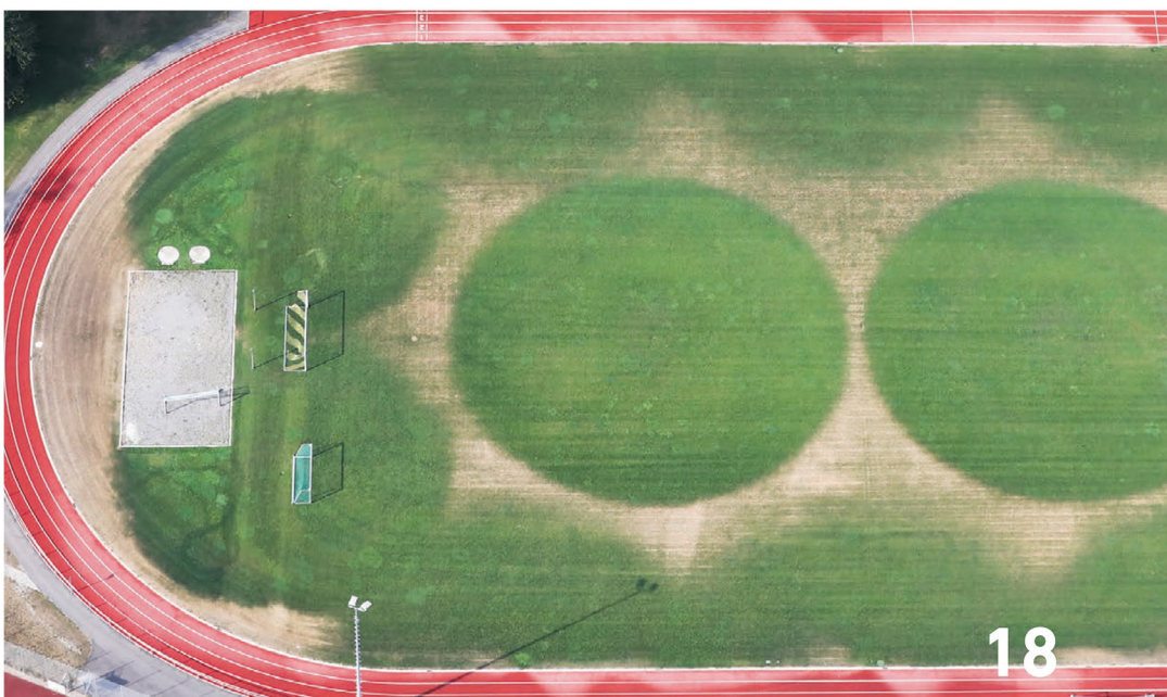
Doppelrolle: Der globale Sport ist für reichlich CO 2 -Emissionen verantwortlich und zugleich von Klimafolgen wie Dürre betroffen. Bei diesem Fußballfeld im baden-württembergischen Bad Buchau war im Sommer 2018 deutlich zu erkennen, bis wohin die Bewässerungsanlagen reichen.