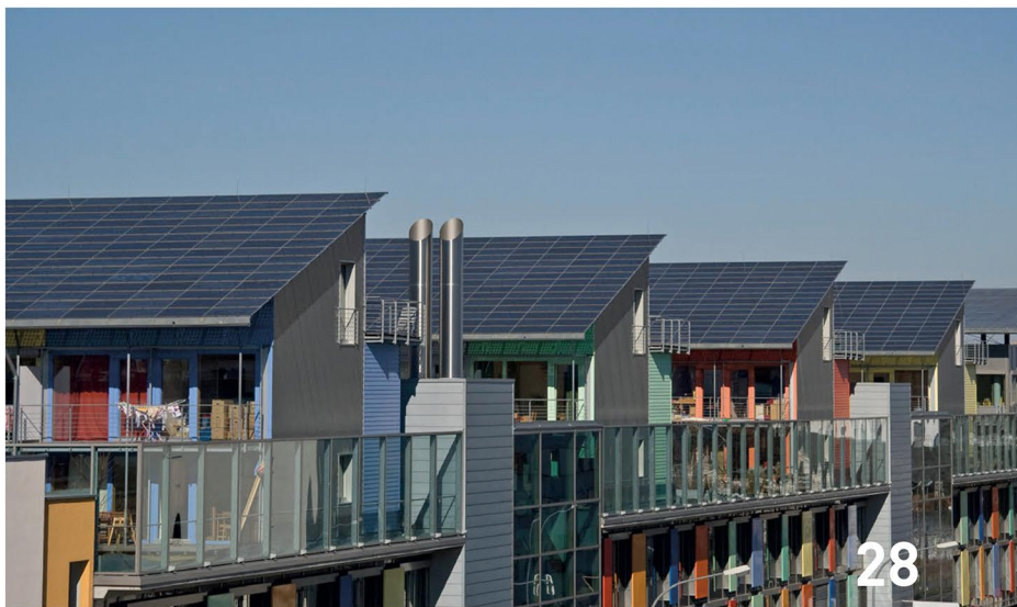
Aufbruchsignal? Solaranlagen gibt es neuerdings auch bei Ikea. Bislang bleibt der deutsche Markt jedoch unter seinen Möglichkeiten.