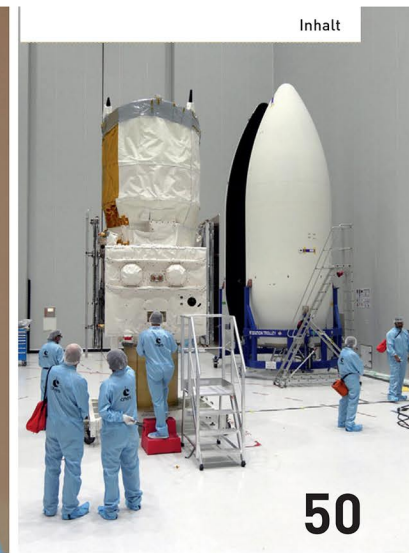
Windmesser: Der europäische Satellit Aeolus im Raumfahrtzentrum.