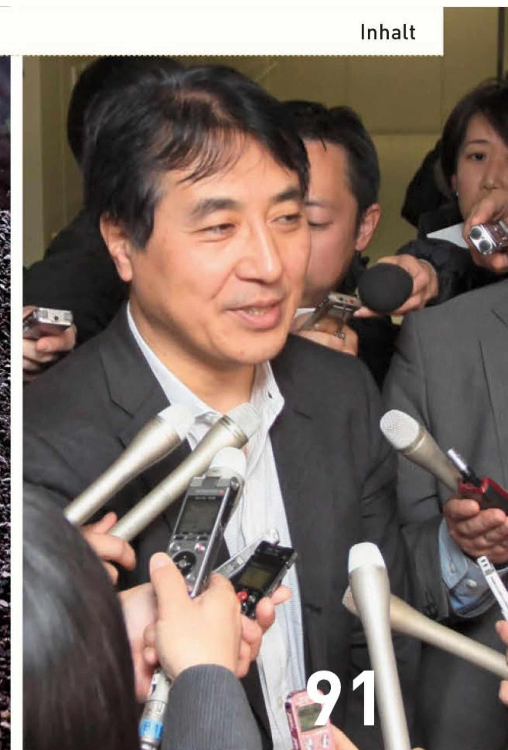
Gefragter Experte: Der japanische Energiewende-Pionier Tetsunari Iida.