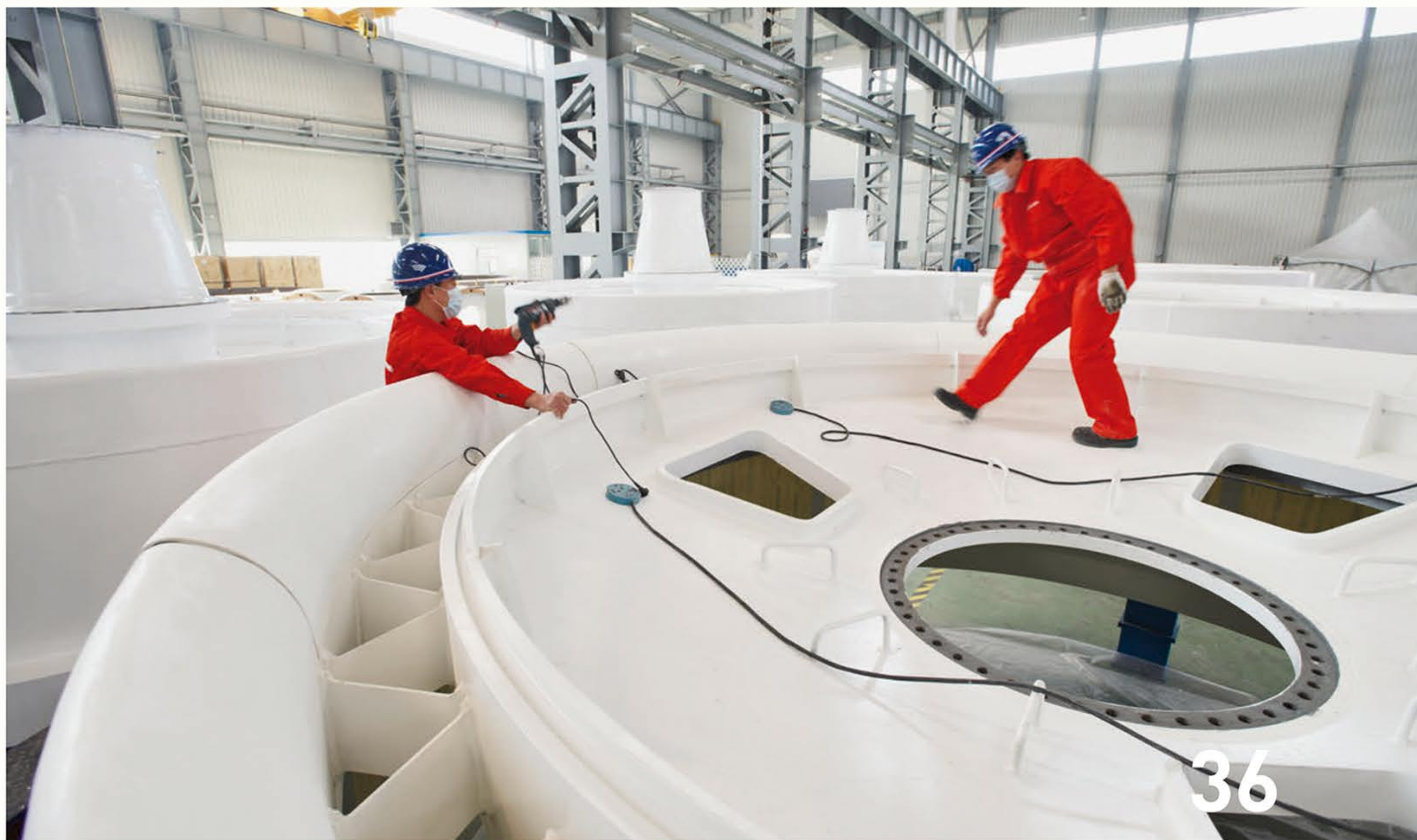
Unter Druck: Die deutsche Windindustrie braucht Innovationen, auch um Herausforderer wie Goldwind aus China auf Distanz zu halten.