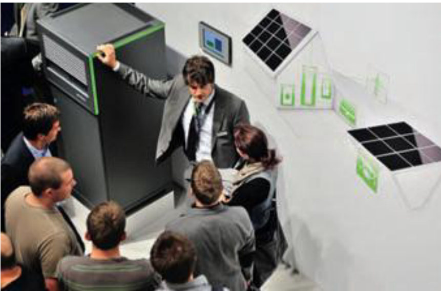
Unscheinbare Kisten: Batteriespeicher sind nicht so sexy wie Solarmodule, aber derzeit das große Thema in der Solarbranche.

nie so schlecht“, sagte er. Ein wesentlicher Grund dafür sei der nun schon seit Monaten schwelende Streit um die Kürzung der Solarförderung in Deutschland. Im März beschloss die deutsche Bundesregierung, die Einspeisetarife im global größten PV-Absatzmarkt um bis zu 30 Prozent zu kürzen und so den Zubau auf 2,5 bis 3 GW pro Jahr zu begrenzen. Im Mai blockierten die Bundesländer im Bundesrat