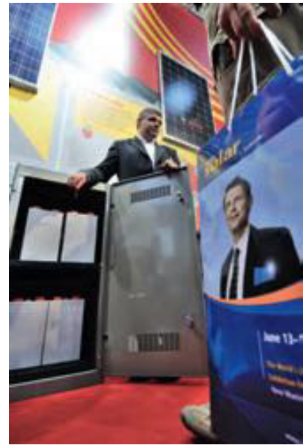
Großes Interesse: Wie lässt sich Strom von eigenen Dach nutzen? Viele Firmen hatten auf der Intersolar eine Antwort parat.

nis. Angesichts der dramatischen Überkapazitäten, die der Branche derzeit zusetzen, empfanden viele Aussteller Talesuns Auftritt als Affront.