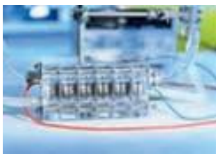
Elektrolyse live: Im Labor lässt sich die Erzeugung von Wasserstoff aus Strom und Wasser sichtbar machen.

Japan und die USA, die verbleibenden Länder mit nennenswerter Solarindustrie, sind längst unabhängig. Beide leisten sich eine eigene starke Solarforschung und wollen diese noch ausbauen. So will die amerikanische Regierung die Kosten für Solarstrom bis 2020 unter das Niveau von