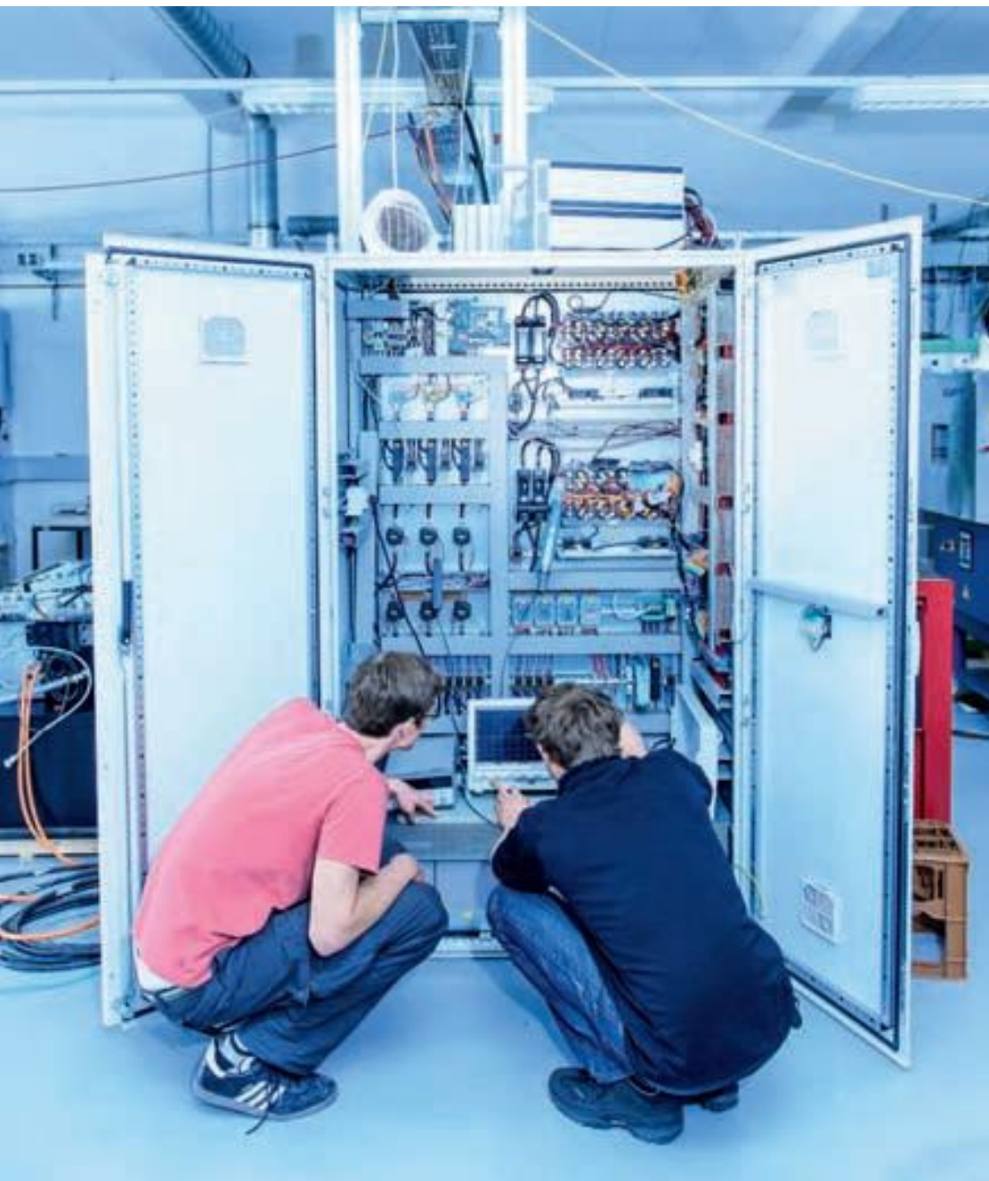
Mit Spannung erwarten Forscher des Fraunhofer ISE die Messdaten ihres neuen Batteriehybriden.

„Deutschland kann seine Technologieführerschaft nur mit hochqualifizierter Forschung und Entwicklung behaupten.“