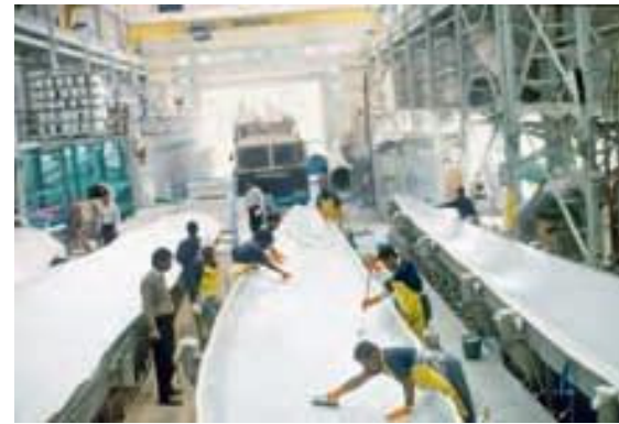
Blatt für Blatt: Die Flügel baut EIL in Daman.

Auf politischer Ebene laufen indessen Gespräche zwischen Berlin und Delhi. Das Bundeswirtschaftsministerium unterstützt Enercon „im Wege der politischen Flankierung“ in „seinen Bemühungen um eine tragfähige Lösung“, sagt dessen Pressespre-