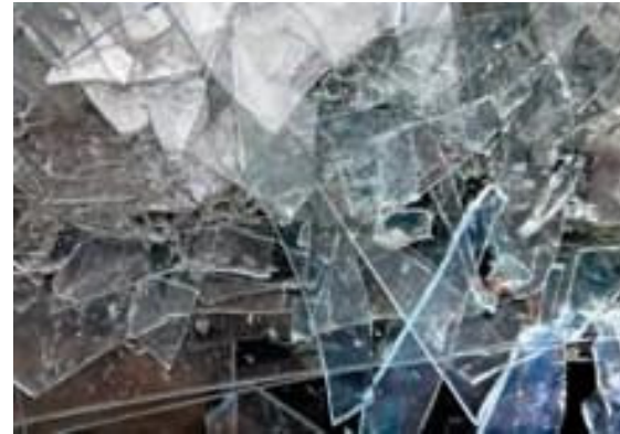
Blankgeputzt: Nach dem Säubern (unten) ist das Glas der Metallbeschichteten CIGS-Modulscherben (oben) wieder so durchsichtig wie vor der Verarbeitung zu Solarzellen.

portieren und Zerlegen alter Solarplatten überhaupt wirtschaftlich lohnt. Bei heutigem Stand der Technik arbeite eine Aufbereitungsanlage erst ab 20 000 Tonnen im Jahr rentabel, erklärt Wambach. Und diese Rechnung geht nur bei den gegenwärtigen Energie- und Rohstoffpreisen auf. Werden Glas und Metalle billiger oder die für die Stofftrennung benötigte Energie teurer, müssten größere Mengen recycelt werden, damit sich die Anlagen rechnen. Die Recycler in spe erwarten auch organisatorische ►