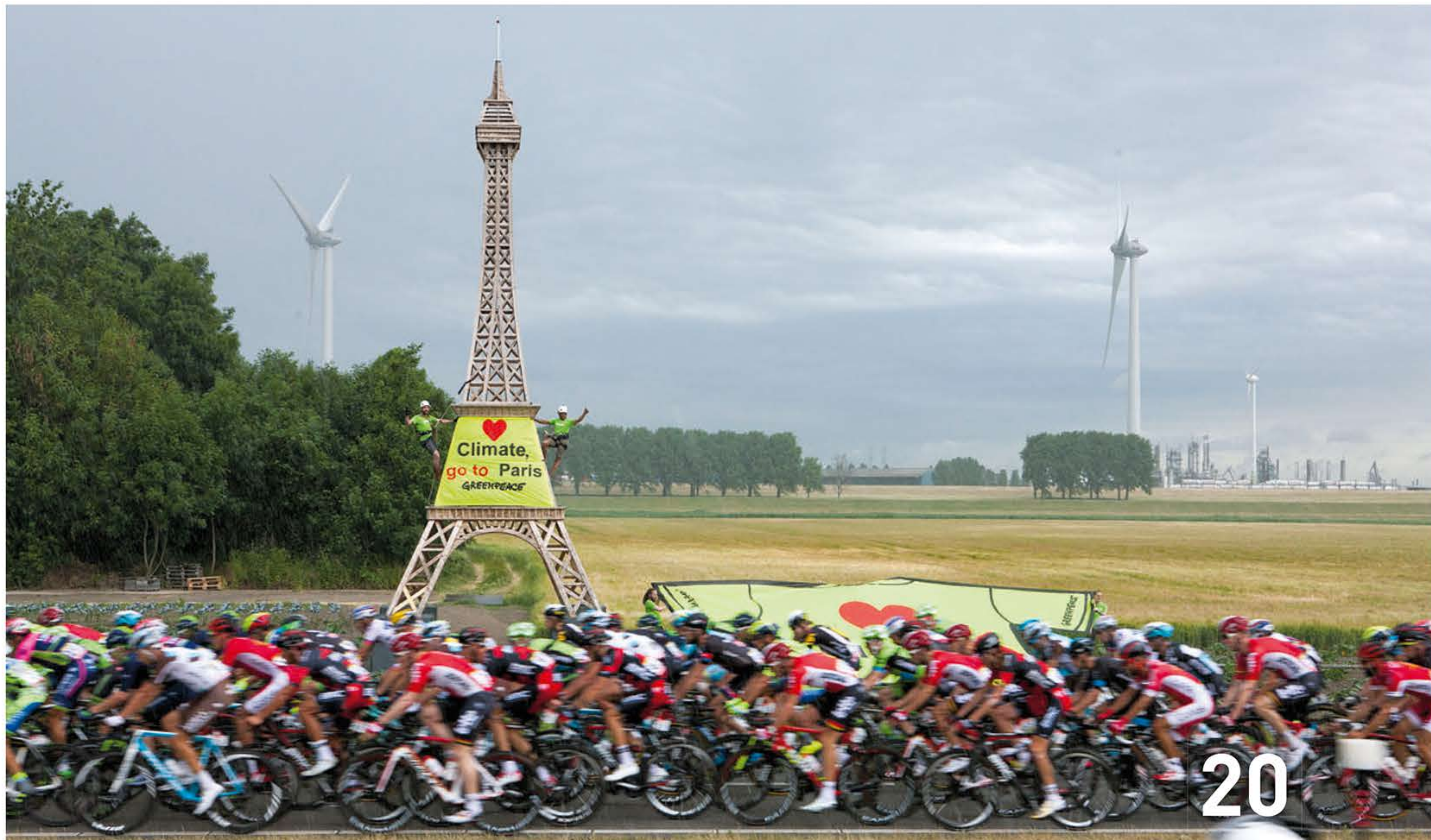
Paris im Blick: Die Fahrer der Tour de France sind schon dort angekommen, die Vorbereitungen zur Klimakonferenz laufen dagegen noch.