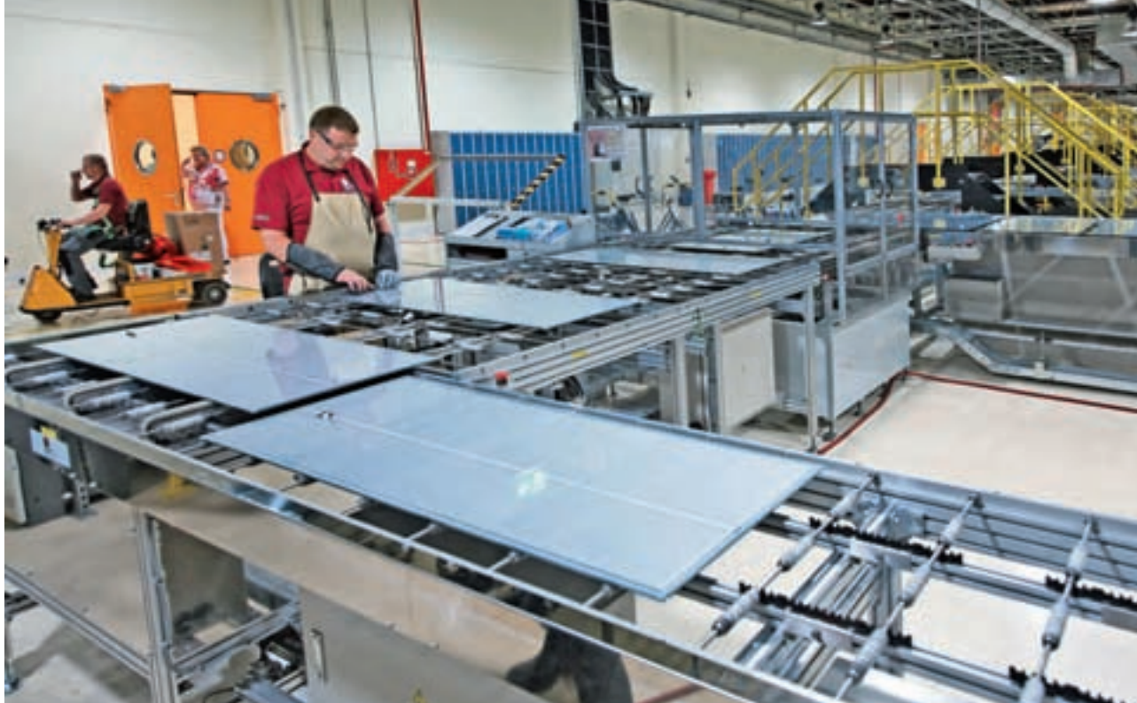
Spiegeln: Neben der bestehenden Fabrik in Frankfurt/Oder beginnt First Solar ab September mit dem Bau einer identischen Kopie. Auch die Produktionslinien im Inneren werden sich kaum unterscheiden.

eine Produktionskapazität von 1,3 Gigawatt erreichen. Gegründet wurde das Unternehmen 1999 in Tempe im US-Bundesstaat Arizona von der Unternehmerfamilie Walton. Der Einstieg ins Solargeschäft gelang den Besitzern der Supermarktkette Walmart durch die Übernahme von Solar Cell Inc. (SCI): ein Solarunternehmen, das Know-how zu Dünnschichtsolarmodulen auf Basis des Halbleiters Cadmium-Tellurid besaß, eine Technologie mit amerikanischer Tradition. Schon in den 60er Jahren produzierten US-Unternehmen wie General Electric oder Kodak Solarmodulen aus dieser kristallinen Verbindung.