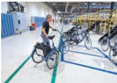
Tempo: In der riesigen Produktionshalle verkürzen Dreiräder den Arbeitsweg.

gewesen, hätte der Hersteller trotz seines Produktionskostenvorteil von 20 bis 30 US-Cent pro Watt gegenüber den führenden kristallinen Herstellern alt ausgesehen.